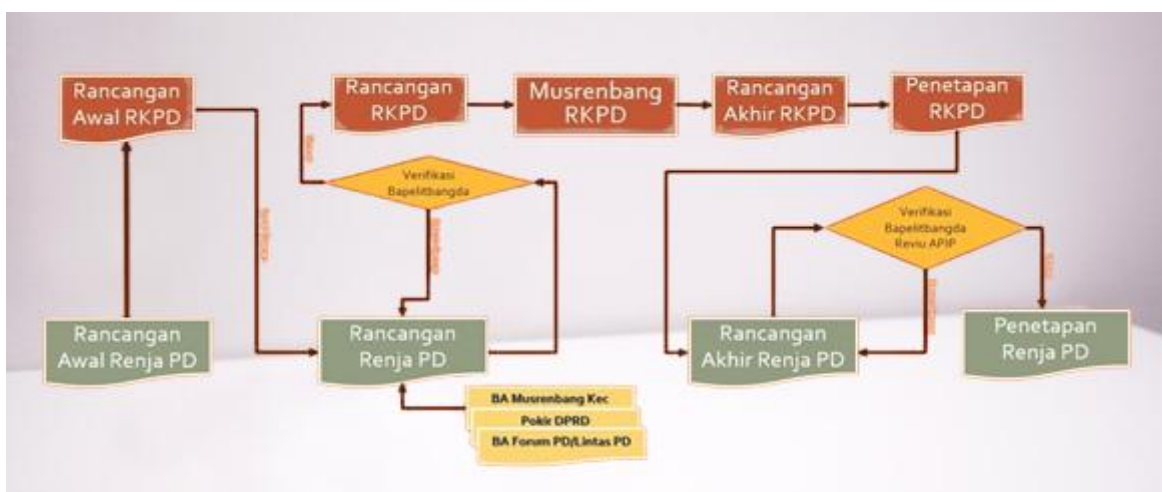
Gambar 1. 1 Tahapan Penyusunan Renja